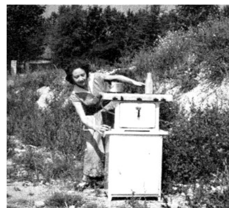
Une Simple histoire de Marcel Hanoun

Però, què trobem més enllà de l'eix, més enllà de l'antropocentrisme, darrere el mirall? El nostre univers invertit? O la possibilitat d'un altre món? L'obra de Marcel Hanoun no té res utòpic; sobretot trobarem la possibilitat de copsar el negatiu, de localitzar-lo i de respondre-hi. Per exemple, el balanceig inaugural de Jung autoritza al final del procés aquest pla hipotètic, aquest pla vertiginosament negre i breu del botxí que finalment crida, «Sí, he matat!» Cap dels protagonistes de SHOAH no confessarà mai, tal com ho recorda immediatament la veu en off de Marcel Hanoun: «Imagino desesperadament que en Jung podria enfonsar-se i reconèixer els seus crims. S'ha de reconèixer que és impossible.» Però la imatge condicional de l'esdeveniment impossible crida