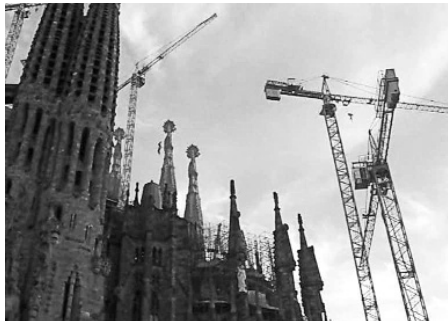
Déconstruction de Marcel Hanoun