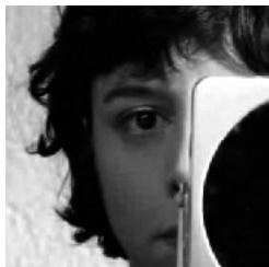
Jeanne Aujourd'hui de Marcel Hanoun