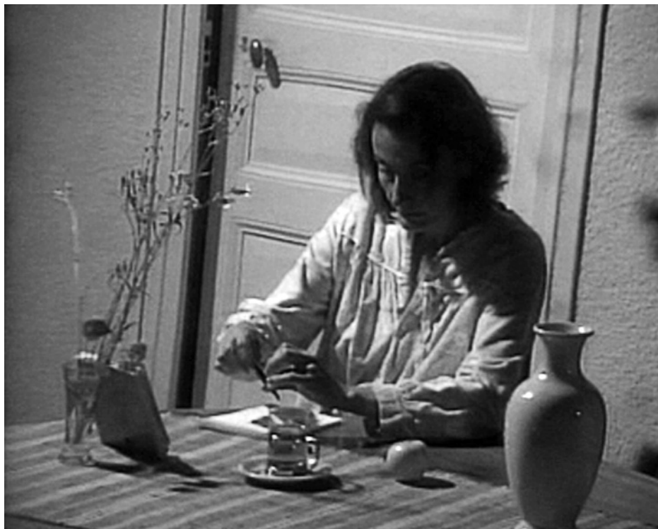
Un arbre fou d'oiseaux de Marcel Hanoun

R.: Cerco contínuament mostrar a l'espectador, tot seguint eixos diferents, el treball de producció de la pel·lí-