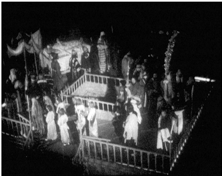
Le mystère d'Elche de Marcel Hanoun

ativitat i la imaginació. La majoria de les vegades, estic obligat a ser el meu propi productor. No em correspon pas a mi d'exercir aquest paper, és una tasca massa feixuga. També hi he estat obligat, perquè, sistemàticament, se m'ha denegat la bestreta sobre la recaptació en projectes interessants com ara LOUISE LABBÉ i tants d'altres. De tots aquest projectes, n'hi ha alguns que els he pogut tirar endavant, malgrat haver-me denegat la bestreta, però a un preu elevadíssim; a causa d'haver d'invertir els meus esforços de creació en altres qüestions, en comptes de fer-ho en allò específicament creatiu, tot exercint un paper que, generalment, no hauria de ser del realitzador.